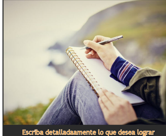
Escriba detalladamente lo que desea lograr

¿Cuál es la solución?, ¿Cómo se puede manejar de forma diferente?, ¿Quién puede ayudar a resolver esto?, Si yo fuese... ¿cómo lo manejaría?, ¿Qué recursos necesito para manejar esto?, etc.