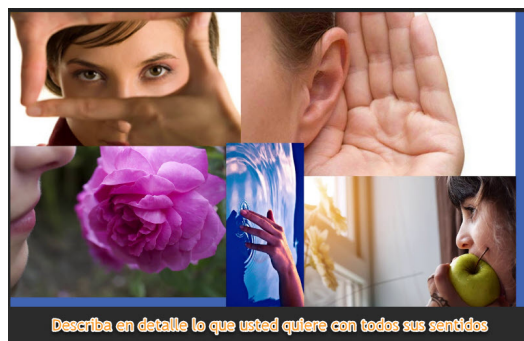
Describe en detalle lo que usted quiere con todos sus sentidos

Existe una estrategia por excelencia para reprogramar su vida para lograr cambios y también para lograr alcanzar lo que usted desea. El primer paso para iniciar esta estrategia es escribir y definir con todos los detalles lo que usted quiere lograr. Defina exactamente lo que quiere lograr, con quien, cómo, porqué, cuanto, cuando etc. También escriba el porqué lo quiere lograr, esto define la intención. Describa sensorialmente como usted se va a ver, sentir, hablar, etc al lograr lo que desea. Use una estructura lingüística que sea positiva y con buenas afirmaciones. Hable como si ya lo ha logrado.