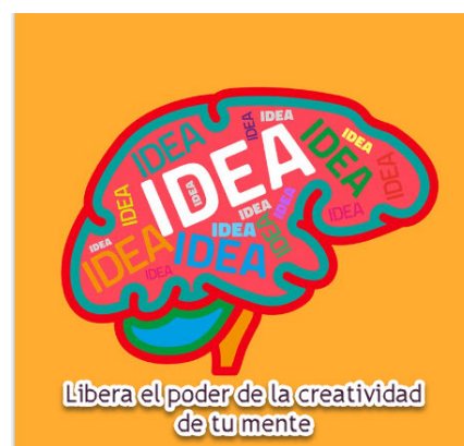
Libera el poder de la creatividad de tu mente

Los logros se originan en la mente, luego toman la primera etapa de la realización cuando uno lo escribe y luego se convierte en realidad. Este es el fluir de la energía de nuevas ideas y logros deseados. Lea artículos relacionados a estos procesos en nuestra página web: Artículos | Neurolinguistica (melvinruiz.com) .