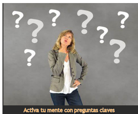
Activa tu mente con preguntas claves

Otra estrategia para facilitar el proceso creativo de su mente es dejar de intentar de recordar trivialidades durante su día. Por ejemplo, intentar recordar que tiene que comprar algo al salir del trabajo, hacer alguna llamada, o hacer alguna diligencia. Mucha gente, gastan mucha energía mental intentando de recordar trivialidades. Escríbalo, vacíe su mente para pensamientos más creativos. Cuando llegue el momento, entonces haga referencia a su lista de cosas para realizar.